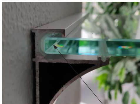
Figur 2. Gummiliste